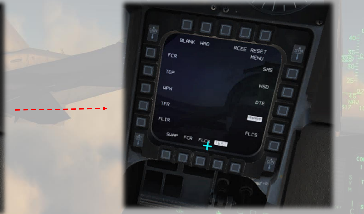
Page de Gestion du MFD