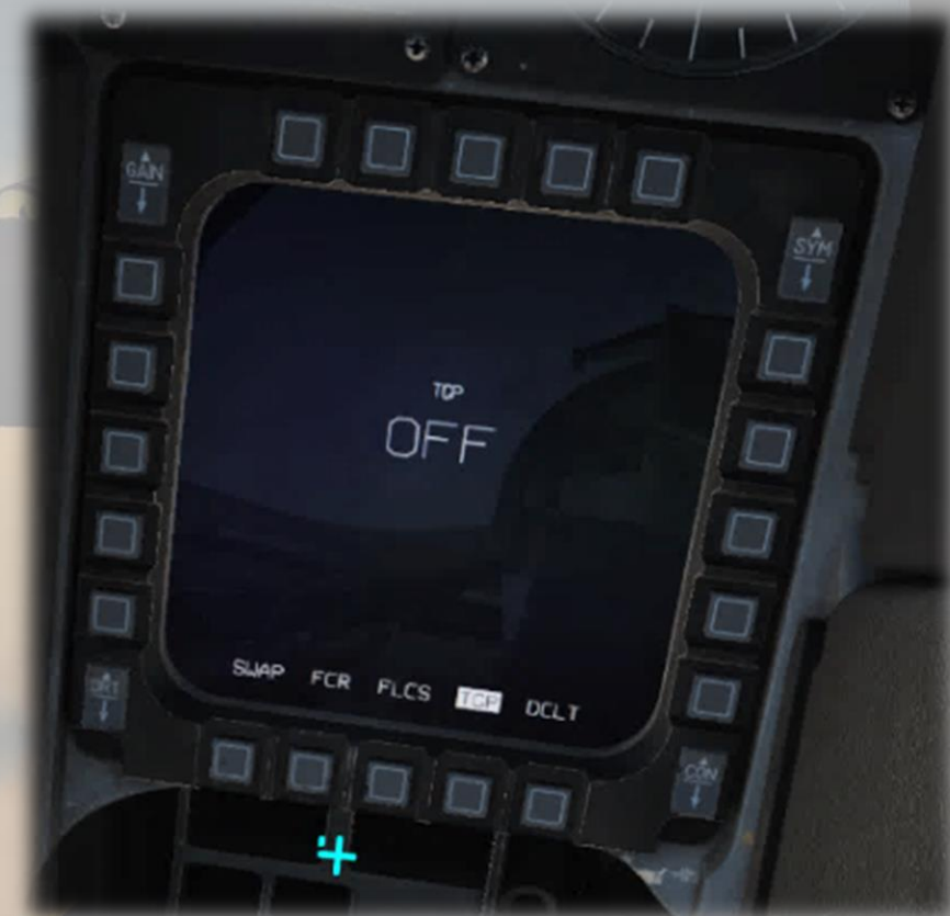
Page Finale : TGP