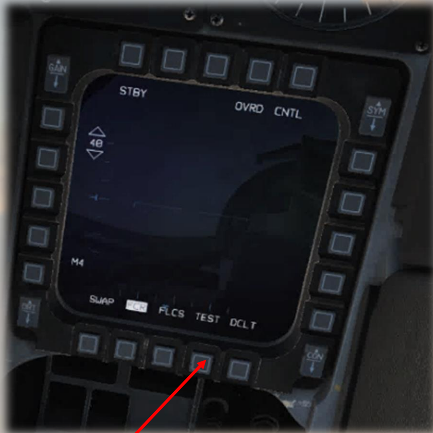
Page Initiale : FCR