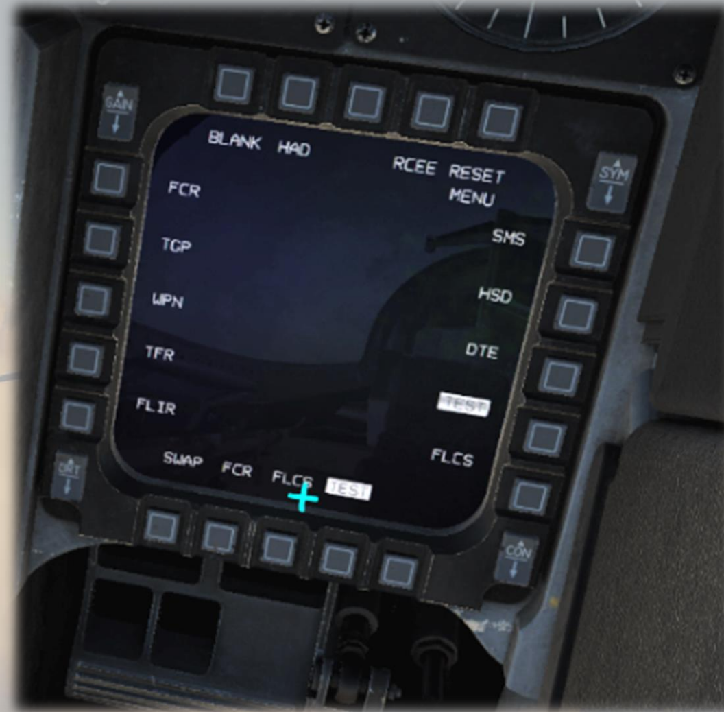
Description de la page de gestion du MFD