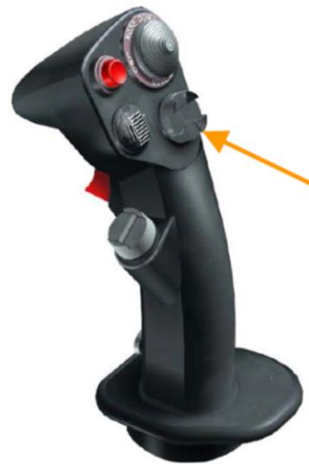
Display Management Switch