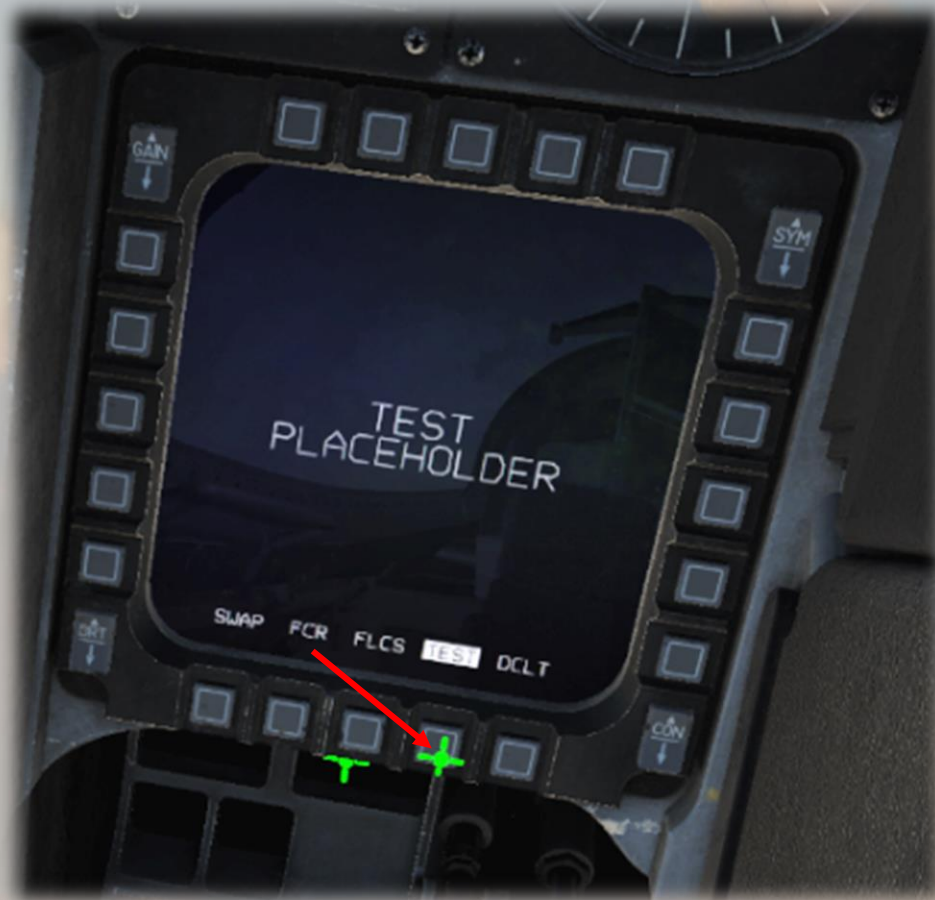
Page Finale : Test