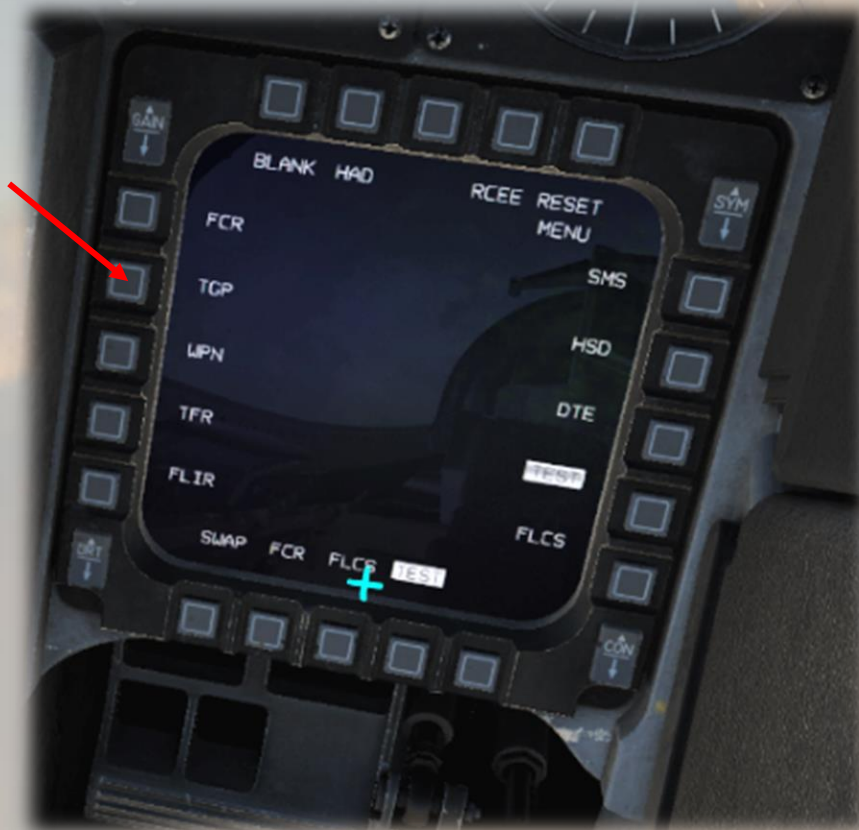
Page de Gestion du MFD

Programmation des pages accessibles via le DMS