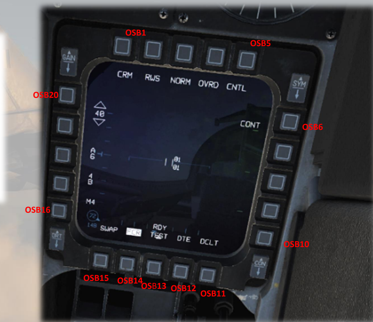
Présentation générique du MFD