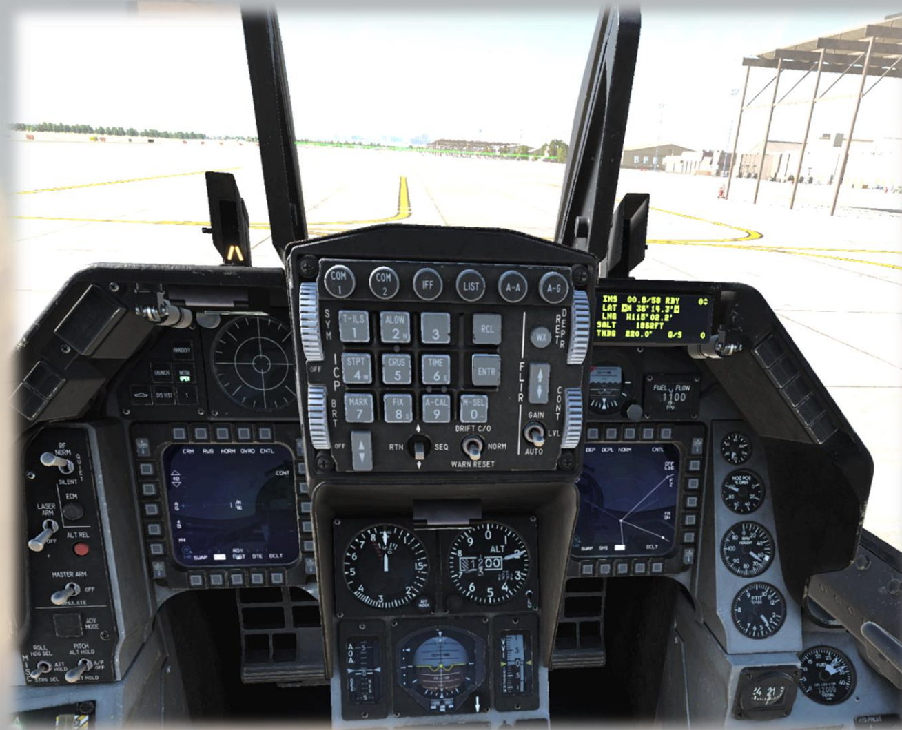
Etats des MFCD à la fin de la mise en route