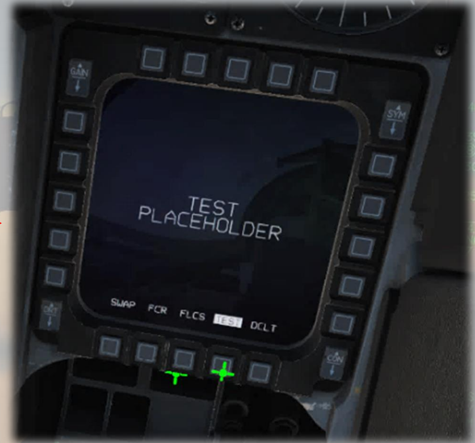
Page Finale : Test