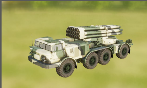
MLRS Uragan BM-27

Trouver et détruire à la munition non guidée l'artillerie de type MLRS BM-27 Uragan